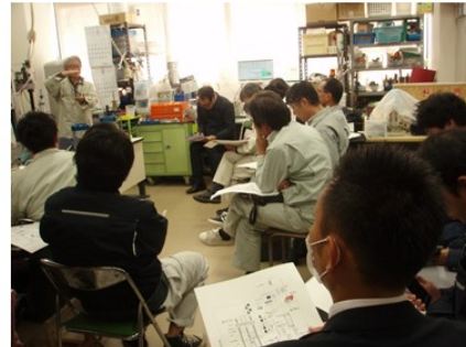
セミナーの受講状況