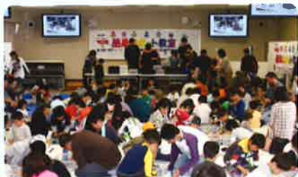
簡単プリント教室