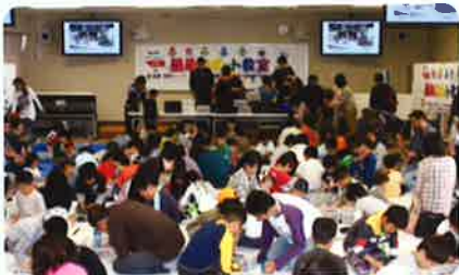
簡単プリント教室